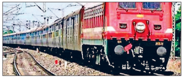
रेवाड़ी। उत्तर-पश्चिम रेलमार्ग से गुजरती ट्रेन।

रेलवे की ओर से चुरू-आसल रेलखंड के मध्य तकनीकी कार्य के लिए ब्लॉक लिया जा रहा है। कार्य के कारण रेल यातायात प्रभावित रहेगा। उत्तर पश्चिम रेलवे पर संचालित रेलसेवाएं आंशिक रद, मार्ग परिवर्तित व रीशेड्यूल रहेंगी। गाड़ी संख्या 54789 रेवाड़ी-बीकानेर सवारी गाड़ी 11 सितंबर को रेवाड़ी से प्रस्थान करके सादुलपुर को ही संचालित होगी। गाड़ी संख्या 54790 बीकानेर-रेवाड़ी रेलसेवा 11 सितंबर को बीकानेर के स्थान पर सादुलपुर से प्रस्थान करेगी। यह