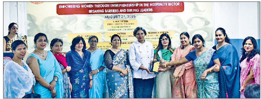
रेवाड़ी। कार्यशाला में अतिथियों का स्वागत करते आईजीयू स्टाफ।