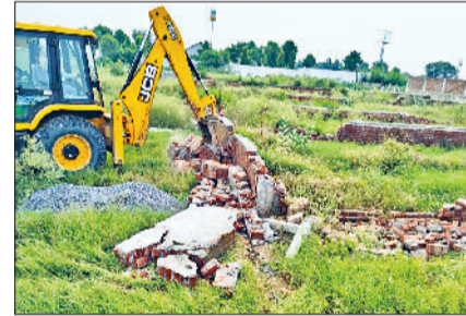
वाड़ी। अवैध निर्माण तोड़ती डीटीपी की जेसीबी, अवैध निर्माण तोड़ती डीटीपी की जेसीबी।

डीटीपी की टीम ने शुक्रवार को बावल रसियावास रोड व दिल्ली-जयपुर राष्ट्रीय राजमार्ग की राजस्व सीमा में अवैध रूप से विकसित हो रही लगभग 9 एकड़ की अवैध कॉलोनी में तोड़फोड़ की कार्रवाई की। डीटीपी की इस कार्रवाई से अवैध रूप से निर्माण करने व कॉलोनीयों काटने वाले लोगों में खलबली मच गई। डीटीपी ने बिना अनुमति कॉलोनीयों विकसित करने वाले व प्लॉटिंग के बाद निर्माण करने वाले लोगों के खिलाफ कार्रवाई तेज की हुई है। शुक्रवार को डीटीपी की टीम रसियावास रोड पर जेसीबी मशीन और पुलिस बल के साथ पहुंची। इस दौरान डीटीपी की टीम ने करीब 6 एकड़ में विकसित हो रही अवैध कॉलोनी में 23