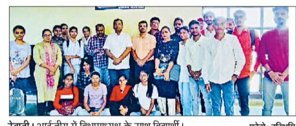
रेवाड़ी। आईजीयू में विभागाध्यक्ष के साथ विद्यार्थी।

पर आई शिकायतों की विभागवार समीक्षा कर सभी विभागों के अधिकारियों को निर्देश दिए। उन्होंने कहा कि सभी अधिकारी शिकायतों को गंभीरता से लें और इनका समयबद्ध निपटारा करें। हर रोज अपना पोर्टल जरूर चेक करें और निर्धारित समय पर एक्शन टेकन रिपोर्ट अपलोड करें। उन्होंने कहा कि ऑनलाइन पोर्टल पर आने वाली जन शिकायतों के त्वरित समाधान के लिए सभी विभागध्यक्ष गंभीरता से कार्य करें। उन्होंने बताया कि सबसे ज्यादा शिकायतें एचएमसीपी विभाग की हैं, उन्होंने एचएमसीपी विभाग के अधिकारियों को सभी शिकायतों का एक सप्ताह में समाधान करने के निर्देश दिए। डीसी ने बताया कि सीएम विंडो व जनसंवाद में जिले का स्कोर अच्छा है, इसी प्रकार समाधान शिविर का स्कोर बेहतर बनाना है। सभी विभागध्यक्ष शिकायतों का तुरंत समाधान करें और एटीआर अपलोड करें। डीसी ने कहा कि समस्याओं का समाधान करके आमजन का जीवन सरल बनाया जाए। उन्होंने कहा कि सभी विभागों के अधिकारी शिकायतों का रिव्यू करें। उन्होंने कहा कि गांवों में रास्ते, जोड़व व सरकारी जमीनों पर कब्जा है तो उस पर संज्ञान लेते हुए तुरंत प्रभाव से कब्जे हटवाए जाए। इसके लिए सभी बीडीपीओ की मासिक बैठक भी आयोजित की जाएगी। पुरानी शिकायतों का एक सप्ताह में हल करें विभाग के अधिकारी।