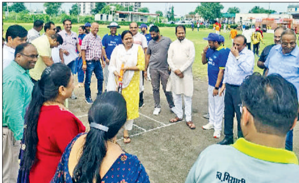
रेवाड़ी। प्रतियोगिता का शुभारंभ करते हुए अतिथि।