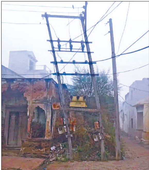
रेवाड़ी। गांव सुमाखेड़ा में झुका हुआ बिजली का पोल व इनसेट में विधायक अनिल यादव।

सरकार भले ही अफसरों को जनप्रतिनिधियों की बात गंभीरता से सुनते हुए जन शिकायतों का तुरंत निपटारा करने का पाठ पढ़ा रही हो, परंतु हकीकत यह है कि कई अफसर आज भी खुद को जनप्रतिनिधियों से ऊपर मानते हुए उनकी बात पर अमल करने से बच रहे हैं। बिजली निगम के एक एसडीओ ने जब कोसली विधायक अनिल यादव को टकासा जवाब दिया, तो एमएलए ने भी एसडीओ की शिकायत विधानसभा की विशेषाधिकार समिति के समक्ष प्रस्तुत कर दी। इससे एसडीओ की मुश्किलें बढ़ना तय माना जा रहा है। बीते दिनों सुमाखेड़ा के सरपंच