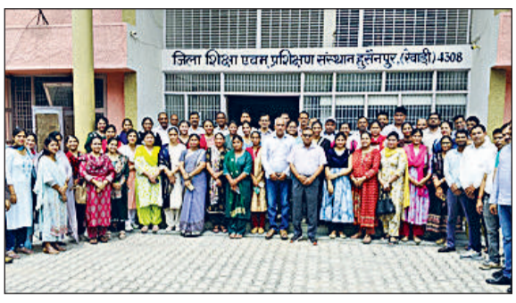
प्रशिक्षण के समापन पर प्रशिक्षकों के साथ शिक्षक।