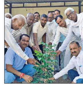
रेवाड़ी। पौधरोपण कर शहीद को श्रद्धांजलि देते परिजन व ग्रामीण।