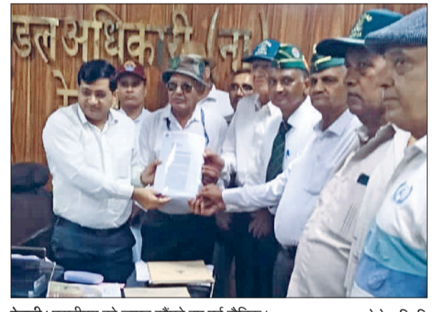
रेवाड़ी। एसडीएम को ज्ञापन सौंपते हुए पूर्व सैनिक।

किया जाएगा। उन्होंने कहा कि इस प्रकार के आयोजन से महिला शक्ति का योगासन व खेलों के प्रति बढ़ावा मिलेगा। प्रतियोगिता केवल महिलाओं के लिए दो आयु वर्गों में आयोजित की जाएगी।