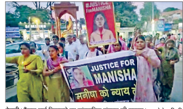
रेवाड़ी। कैडल मार्च निकालते हुए सांस्कृतिक संगठन की सदस्य।

स्कोप प्रदान करने वाला क्षेत्र भी है। इस विषय में स्नातकोत्तर प्राप्त करने के उपरांत विद्यार्थी विभिन्न प्रतिष्ठित क्षेत्रों में अपना भविष्य बना सकते हैं, जैसे कि अनुसंधान संस्थाएं, थिंक टैंक एवं नीति आयोगों में रिसर्च एनालिस्ट के रूप में भारतीय आर्थिक सेवा व सविल सेवाएं, भारतीय रिजर्व बैंक तथा बैंकिंग एवं वित्तीय संस्थानों में आर्थिक विश्लेषक और सलाहकार विश्व व्यापार संगठन, अंतरराष्ट्रीय मोद्रिक बैंक आदि में संभावनाएं हैं।