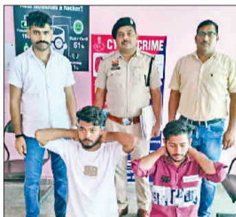
रेवाड़ी। पुलिस गिरफ्तार में टगी के आरोपी।