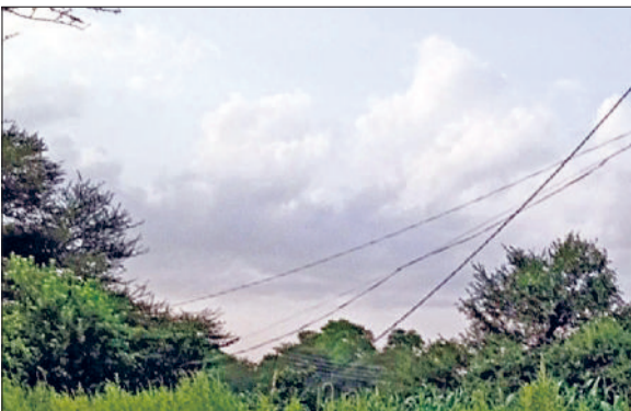
रेवाड़ी। शुक्रवार दोपहर को छापे बरसात के बाद।

साफ रहा। बाद में आसमान में बादल गहरा गए। दोपहर के समय कुछ इलाकों में बूदाबांदी, तो कुछ में हल्की बरसात हुई। अधिकतम तापमान 1.0 डिग्री सेल्सियस की कमी के साथ 34.5 डिग्री पर आ गया। रात का तापमान भी 0.3 डिग्री सेल्सियस की कमी के साथ 22.2 डिग्री सेल्सियस दर्ज किया गया। हवा में नमी का स्तर 75 प्रतिशत तक रहा, जबकि हवाओं की गति 8 किमी प्रति घंटा रही। बार-बार हो रही बूदाबांदी के कारण वातावरण में नमी और उमस बढ़ने से गर्मी का असर कम नहीं हो पा रहा है। दोपहर