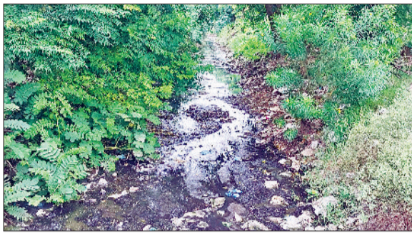
रेवाड़ी। गंदगी से लबालब बावल रोड का बरसाती नाला, सती कॉलोनी चौक पर जमा गंदा पानी व फंसा ऑटो, सती कॉलोनी चौक पर रात के समय जमा नाले का गंदा पानी।

शहर में कहीं सीवर ओवरफ्लो हो रहा है तो कहीं उफनते नालों का गंदा पानी सड़कों पर जमा होकर लोगों के लिए आफत बना हुआ है। मानसून के सीजन में पिछले एक दशक से लाखों का ठेका देने के बाद भी शहर के नालों की सफाई ठीक से नहीं की जा रही है। इस बार नगर परिषद की ओर से शहर के नालों की सफाई के लिए करीब 60 लाख रुपये का ठेका दिया है, लेकिन फिर सड़कों पर नालों का काला पानी जमा हो रहा है। सरकुलर रोड सहित कई नालों की सफाई में खानापूर्ति कर दी गई है। पिछले एक दशक से शहर के नालों की सफाई ठीक तरह से नहीं होने के