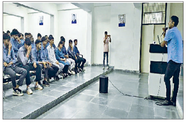
रेवाड़ी। पॉलिटैक्निक कॉलेज में युवाओं को जानकारी देते वक्ता।