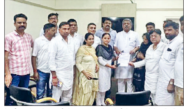
रेवाड़ी। कांग्रेस प्रदेश प्रभारी से मुलाकात करते कांग्रेसी नेता।