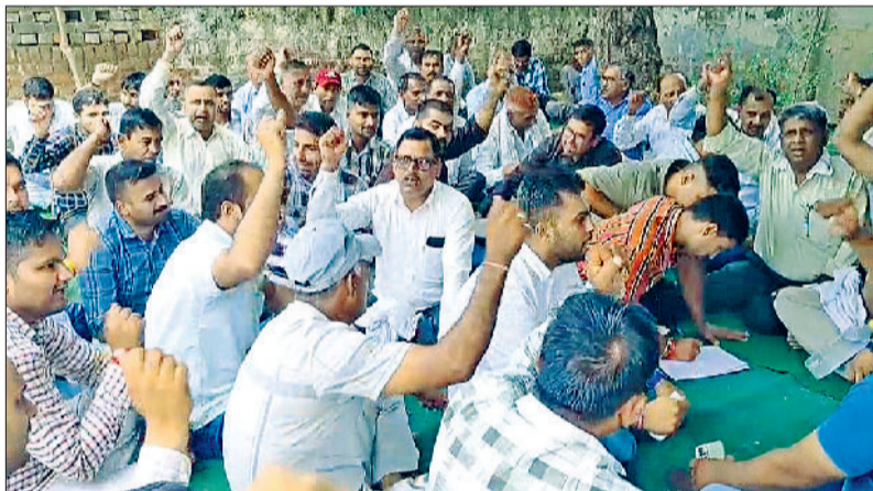
रेवाड़ी। वन विभाग कार्यालय में धरना-प्रदर्शन करते कर्मचारी।